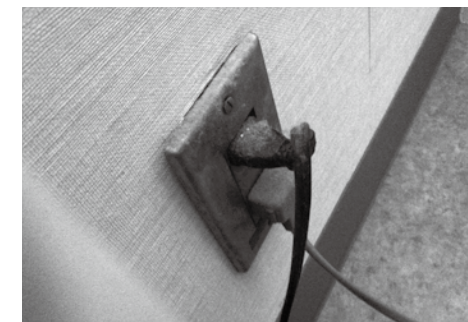
写真1 ほこりを被っているコンセントプラグ

ラッキング現象のおそれがある状態でしたので、トラブル発生前に発見できたのは幸運でした。