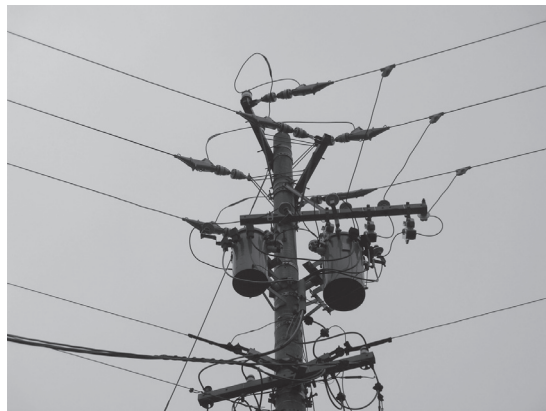
写真1 柱上変圧器の設置例

管理者が深夜まで停電に気が付かなかった理由の一つは、動力系統のみの停電であり、共同住宅の電灯やコンセントには影響がなかったため