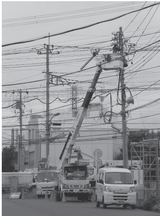
写真2 バケット車による高圧線工事例

管理者から連絡を受け、共同住宅に到着して上記の状況を聞き取り、電力会社に連絡を取りました。深夜、電力会社によって焼損した柱上変圧器が交換(写真2)された後、動力系統の復電が確認