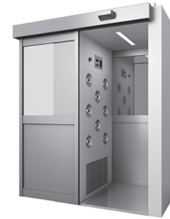
図2 エアシャワーの例