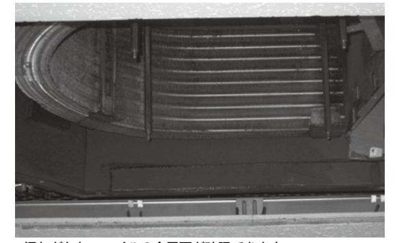
汚れがとれ、coilの金属面が確認できます。

また、coilに付着していた塵埃がなくなったため、居室の浮遊粉塵量が洗浄前に比べ55%減少しました。