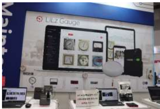
賑わいを見せた LiLz Gauge コーナー

置換換気空調システム「F-PUT」のコーナーでは、フロアマスター吹出口とパッケージエアコンが一体化となった大きな実機が展示され、実機に手を当てて風を体感されているお客様もいらっしゃいました。