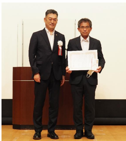
安全活動事業所表彰 東京第一事業部