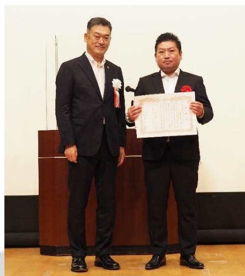
安全活動協力会社表彰 岡城産業(株)様