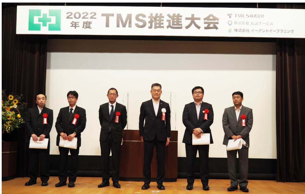
原社長（左から4番目）および安全活動表彰受賞者