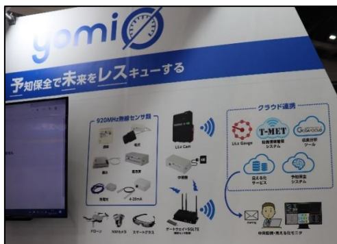
Yomiø (ヨミレス) コーナー