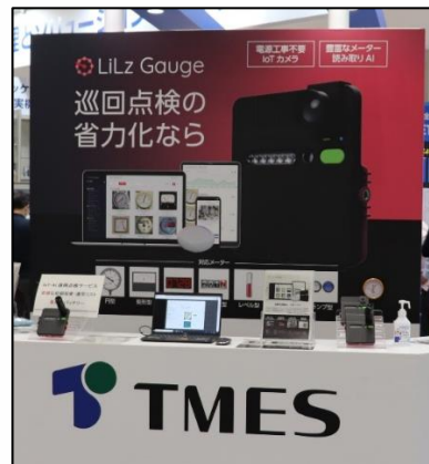
LiLz Gauge コーナー