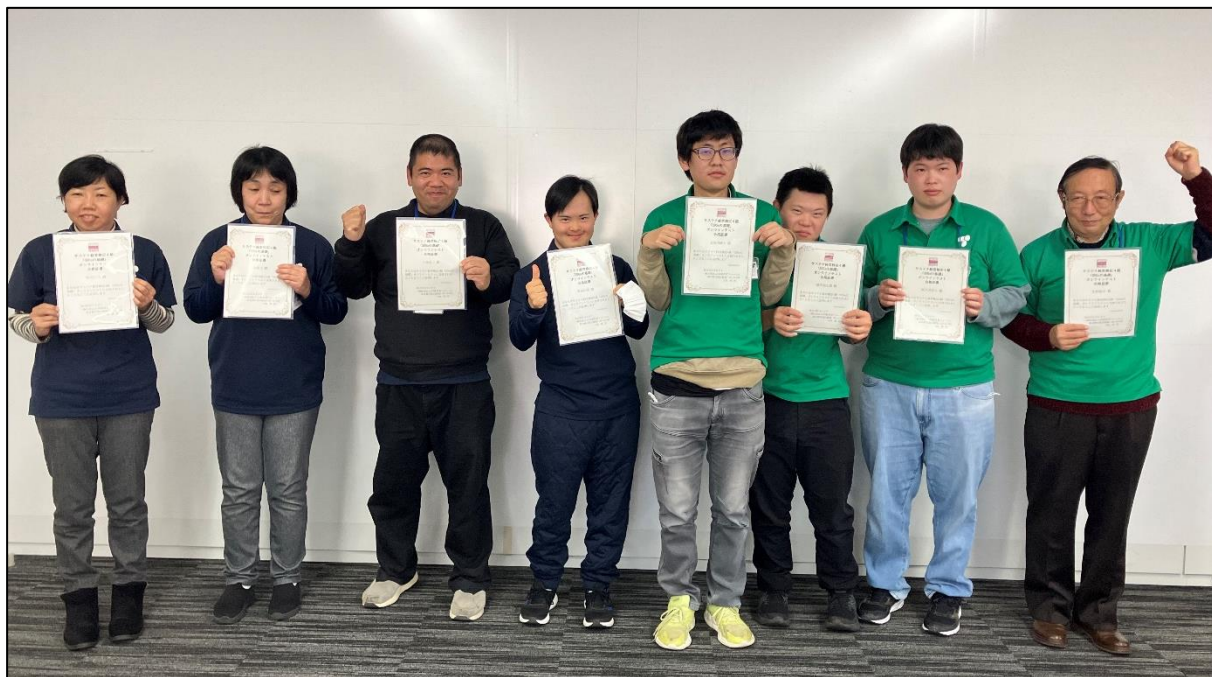
(TMES ファーム川越「みどりのわ」スタッフ写真)

知的・発達障がいのある社員に対し、資格取得挑戦の機会を設けました。今年度はスタッフ全員が「サステナ経営検定4級」を取得しました。日常の業務に留まることなく、スキルアップを図っております。