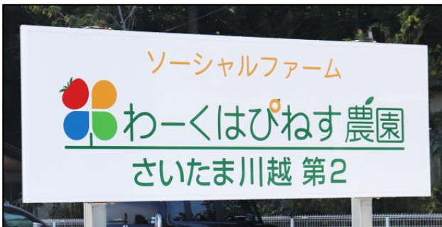
（農園サービス：わーくはびねす農園）

農園サービスでは、弊社が参画した2022年5月から2023年10月の間に、16種類以上・約1,300袋もの無農薬野菜を育てました。収穫した野菜は各拠点での配布会やランチ試食会を社内で開催し、健康増進に寄与しております。また、今年度は子ども食堂へも提供いたしました。