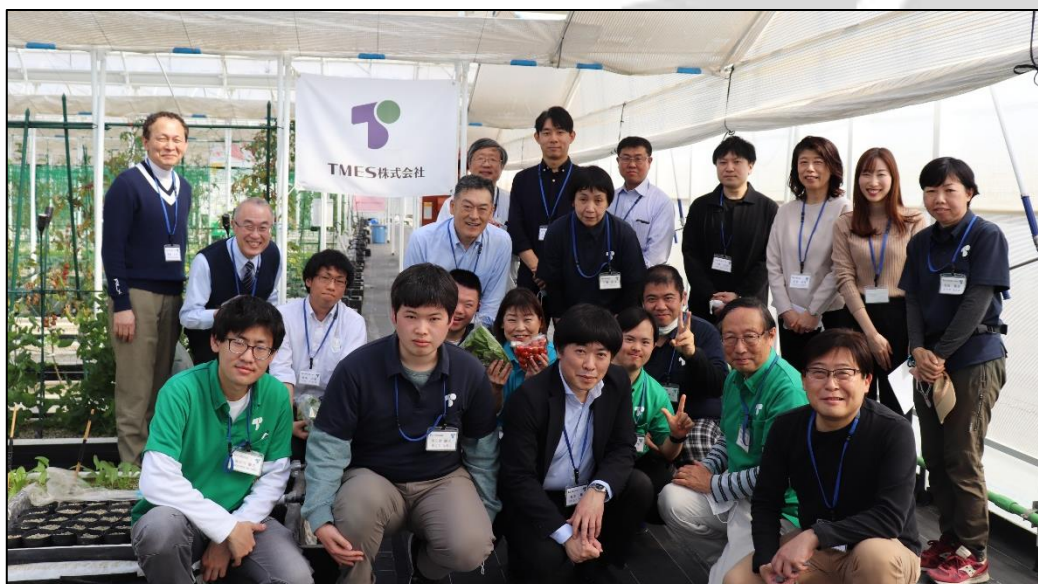
(ノーマライゼーション研修参加者の集合写真)

研修を通して、障がいの特性や、同じ職場の仲間としての日常的な関わり方について一層イメージが膨らみ、障害の有無に関係なく活躍できる職場づくりのヒントを得ることが出来ました。