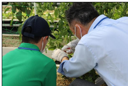
(ビニールハウス内で農作業体験を行う様子)

参加者からは、「障がいの中にも多くの種別があり、性格のように人それぞれの特徴があることを学んだ。」「会社のSDGsへの取り組み、障害がある方への理解が深まった。」「協力して作業をすることで、チームワークやコミュニケーションの重要性を再確認した。」「今後、関わる全ての人に配慮や理解を持ちながら、仕事をしたい。」等の声がありました。