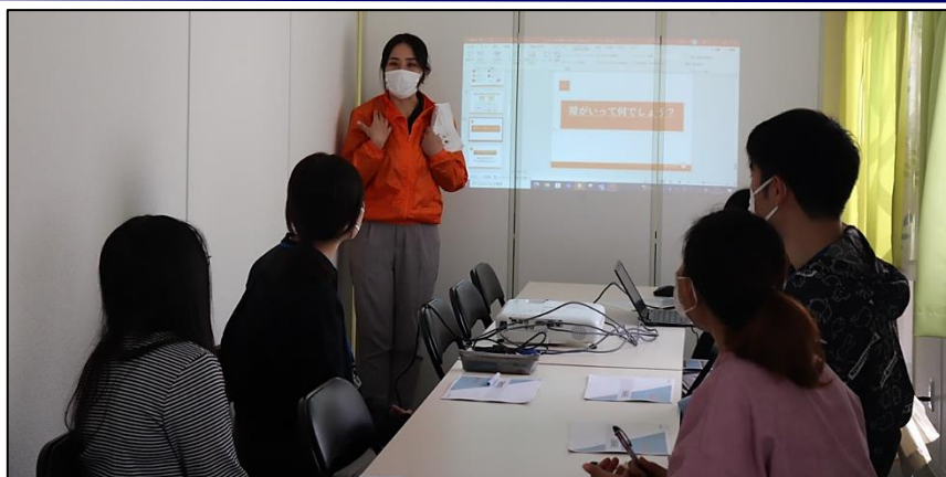
(ノーマライゼーション研修を実施している様子)